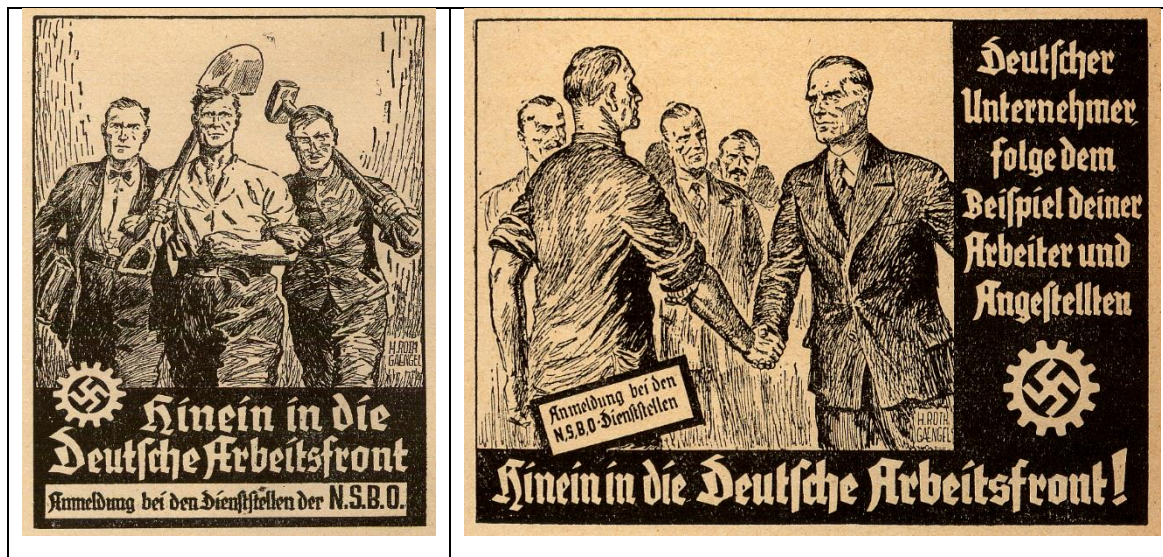
Abb. 2: Anzeigen der Deutschen Arbeitsfront, Quelle: Blätter für Genossenschaftswesen , 81. Jg. (1934), S. 287 und 301

Noch im Jahr 1933 wurden der Gauinspektor der NSDAP in Hamburg, Erich Grahl, als „Staatskommissar“ in die Geschäftsleitung der Hamburger Zentrale GEG eingesetzt (Jahrbuch des ZdK 1947: 62; Bludau 1968: 110 f.), die Konsumgenossenschaften der Hamburger und Kölner Richtung mit ihren Einrichtungen der Verfügungsgewalt der Deutschen Arbeitsfront (DAF) 13 unterworfen, die beiden Verbände zum „Reichsverband der deutschen Verbrauchergenossenschaften G.m.b.H.“ (Hamburg) verschmolzen sowie sämtliche Konsumgenossenschaften und Bezirksrevisionsverbände einem neu errichteten „Revisionsverband der deutschen Konsumgenossenschaften e.V.“ unterstellt. Zudem fand eine Umbenennung der einzelnen Konsumgenossenschaften („Konsumvereine“) in „Verbrauchervereine“ statt. In den Aufsichtsrat des Reichsverbandes, dem zugleich die Aufsicht über den Revisionsverband oblag, waren drei Parteigenossen beordert (Jahrbuch des ZdK 1947: 61 f. und 71 ff.; Bludau 1968: 114)). Auch in die Geschäftsleitung fast jeden Verbrauchervereins war ein NSDAP-„Beauftragter“ eingesetzt.